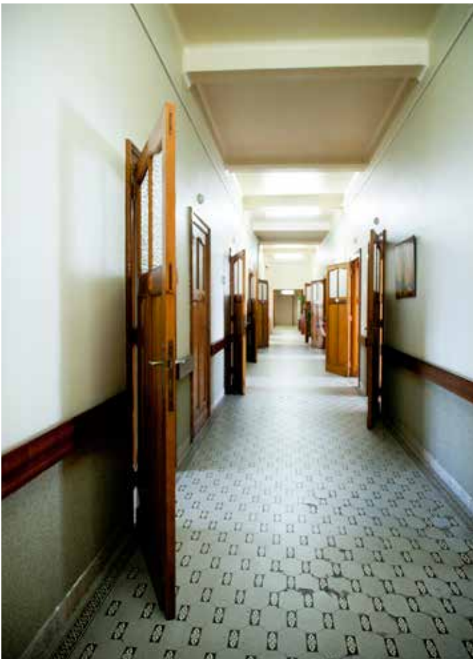
De oude ziekenhuisgang van het voormalige Kanker Instituut: nu omgebouwd tot museum.

voor de epidiascoop, een moeilijk woord voor de projector die men gebruikte om les te geven aan de artsen in opleiding. Een zwart masief toestel met een donkere doek erover. Het toestel werd gebruikt in het vooroorlogse auditorium: ook dat kun je nog in oorspronkelijke staat bezoeken. Duizenden artsen en zorgverleners kregen er hun opleiding en ook vandaag wordt het nog gebruikt voor speciale gelegenheden.” ▶