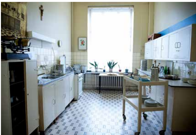
Boven: de melkkeuken vroeger. Onder: de nagebouwde keuken in Histaruz.

ter die me in het Frans mijn eerste opdracht gaf: alle fluïmenpotten leeggieten in het wc, uitschrobben en terug naar de patiënten brengen. Voor mij is het heel bijzonder om die fluïmenpotten nu nog in het museum te zien staan.”