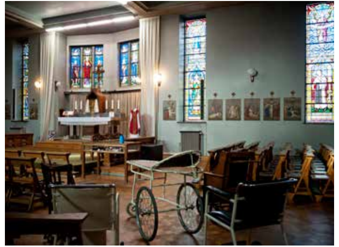
Het ziekenhuismuseum vandaag: een patiëntenkamer en de kapel die er bijna net hetzelfde uitziet als tachtig jaar geleden.

gedeelte hun werk doen. Door de oorlogsomstandigheden werd bovendien drastisch gesnoeid in de materiële middelen van het ziekenhuis.”