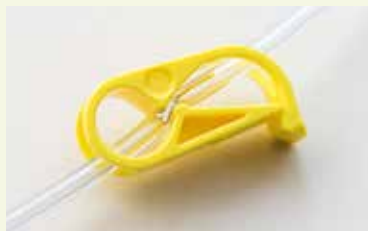
De leiding wordt afgesloten door de klem.