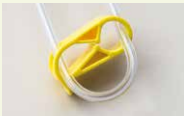
De leiding wordt niet afgesloten door de klem.