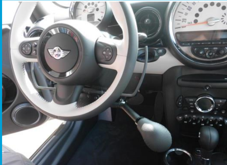
Gas en rem aan het stuur