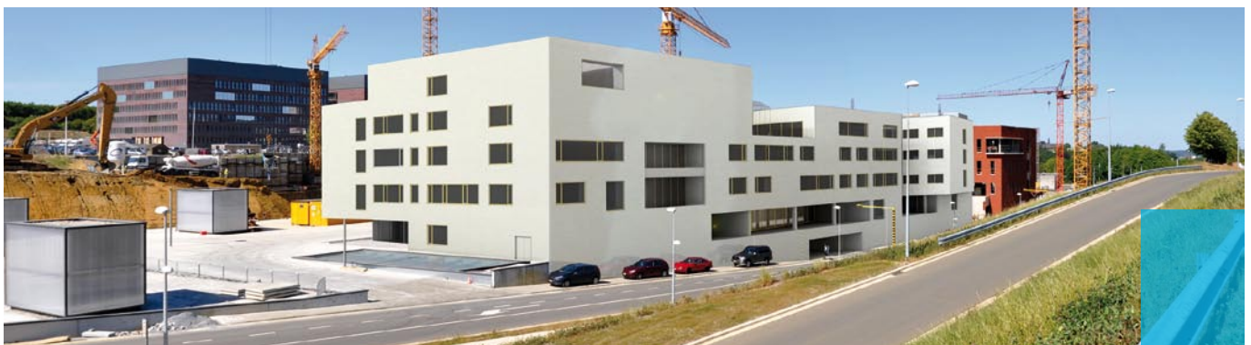
Toekomstig beeld op de nieuwbouw psychiatrie vanaf de Tweekleinewegenstraat

Al in de zomer van dit jaar zal de ruwbouw klaar zijn. Als alles naar wens verloopt, nemen de eerste patiënten en teams begin 2014 hun intrek in het gebouw. |