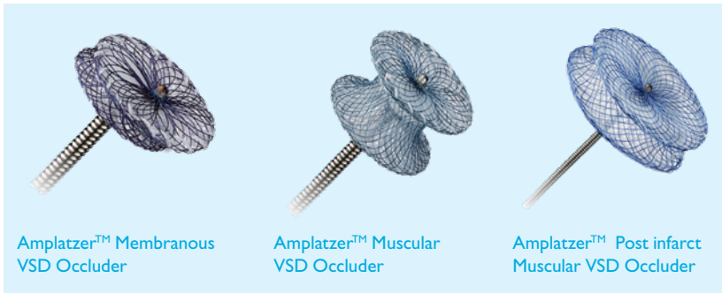
Verschillende soorten 'paraplu's voor de percutane sluiting van een ventrikel septum defect

De percutane sluitingsmethode houdt in dat er via een kleine prik in de lies een katheter wordt opgeschoven en een klein toestel ('paraplu') wordt geplaatst in het VSD. Deze procedure gebeurt onder een lichte algemene narcose. De opnameduur bedraagt drie dagen en twee nachten .