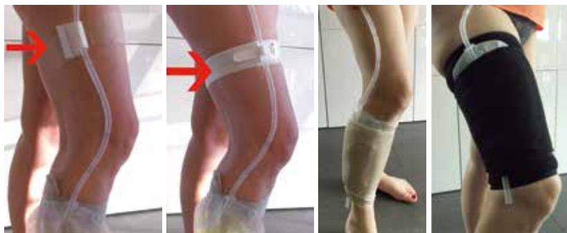
Figuur 15. Transafix®, G-strap, Yvanta comfortbag