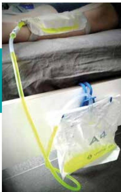
Figuur 8. Koppeling beenzak/nachtzak

U kunt de nachtzak na gebruik doorspoelen, eventueel met azijn (geurhinder: 200 ml water + 100 ml azijn). Vervolgens hangt u de zak op een droge, koele plaats te drogen.