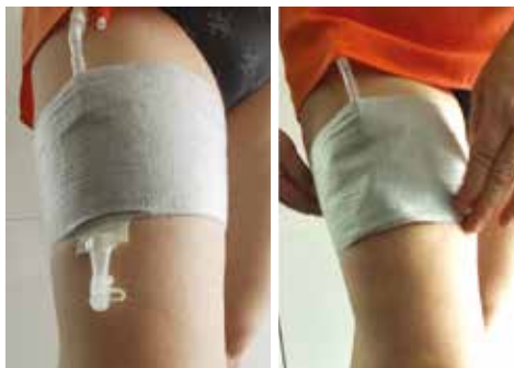
Figuur 14. Conveen® Active dagopvangzak