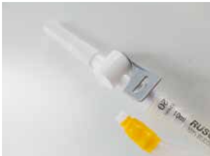
Figuur 10. Flip-Flo