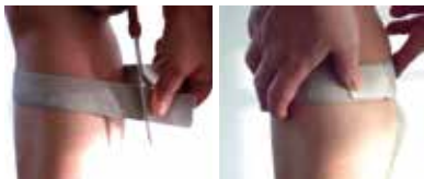
Figuur 4. Beenriempjes aanpassen