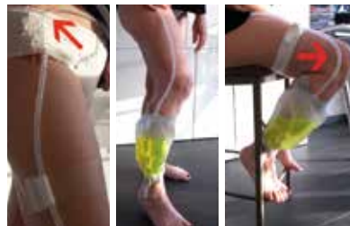
Figuur 5. Leiding en beenzak