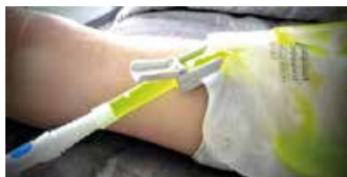
Figuur 9. Openen aftapklepje bij koppeling