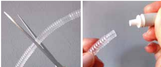
Figuur 6. Inkorten leiding beenzak

U kunt de leiding van de urinezak inkorten door er een stuk af te knippen. Als u een beenzak heeft met geribbelde leiding, is het belangrijk dat u een niet-geribbeld tussenstukje overhoudt (fig. 6), anders past het connectiestukje er niet op. Knip dit gedeelte van de slang af alvorens het connectiestuk met de katheter te verbinden (fig. 6). Indien u het connectiestuk juist aanbrengt, kan het niet meer van de leiding van het beenzakje af.