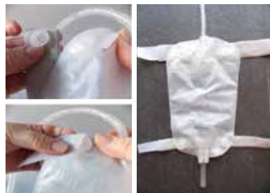
Figuur 3. Knoopsgat