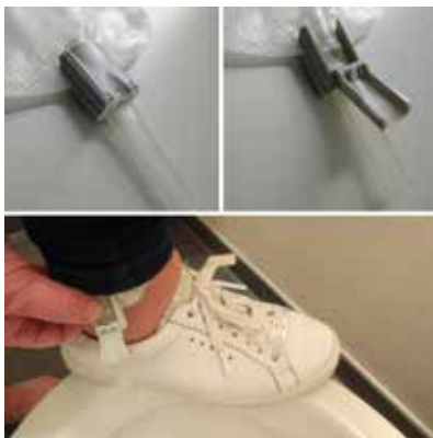
Figuur 7. Aftapklepje

Als de opvangzak leeg is, sluit u het aftapklepje weer door het klepje terug naar boven te plaatsen.