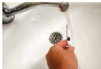
Figuur 13. Spoelen urinezak