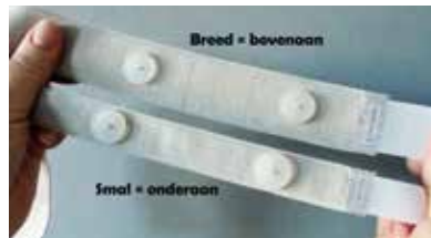
Figuur 2. Beenriempjes

Dit is een urinezak die u aan uw been bevestigt met behulp van beenriempjes (fig. 2) en die u dus onder uw kleding draagt. Op iedere hoek van de beenzak zit een opening waar u de knoop van het beenriempje doorheen haalt (fig. 3). Bevestig de beenriempjes rond uw been en druk de klittenband goed op elkaar. Als de beenriempjes te lang zijn, kunt u het overvallende gedeelte afknippen (fig. 4). Voorzie hier wel enkele centimeters meer, omdat de beenriempjes kunnen krimpen in de was. U plaatst de beenzak best tegen uw onderbeen (fig. 5) of tegen uw bovenbeen, bijvoorbeeld als u een rok of short wil dragen.