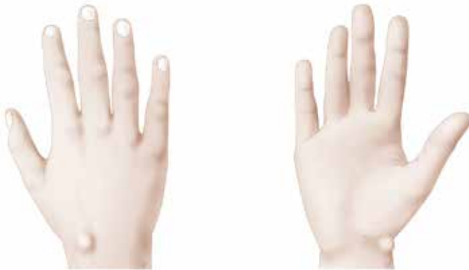
de twee klassieke plaatsen van een polscyste

Een polscyste is een zwelling aan de pols, veroorzaakt door een vochtblaasje in het polsgewricht. Hierdoor is een zwelling te voelen of te zien en deze zwelling kan soms pijnlijk zijn. De twee klassieke plaatsen zijn op de rug van de pols en aan de duimzijde van de palm van de pols.