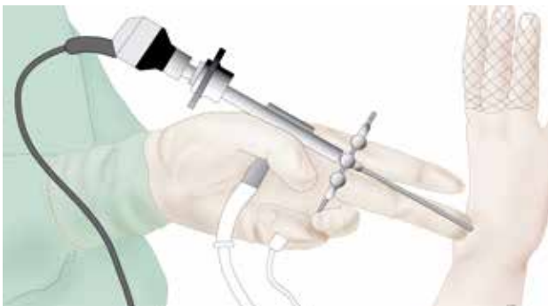
polartroscopie met wegname van de cyste